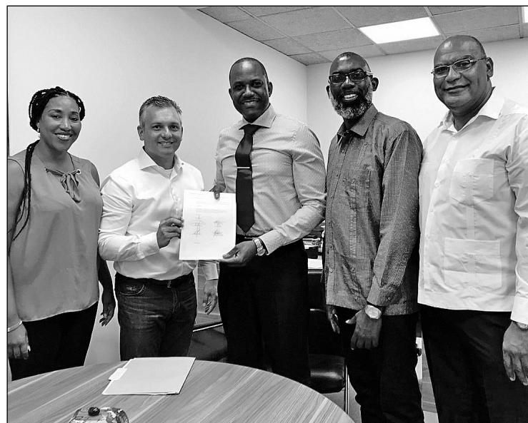
MFK-leden leveren het voorstel in bij de Statenvoorzitter.

„De belangrijkste reden om getint glas te verbieden was om de criminaliteit tegen te gaan. Helaas is er geen enkele informatie of registratie van hoe dit verbod inderdaad bijdraagt aan een betere aanpak van de